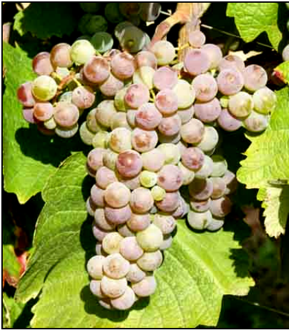
Traube der Sorte „Kövidinka“

Häufig werden die Sorten nach der Beerenfarbe unterschieden wie etwa Rote und Weiße Chasselas, Dunkle, Grüne, Rote und Weiße Kadarka oder Schwarzer Dalmatiner in Selzi, wo auch die Weißweinrebe Dalmatiner gerne angebaut wurde, weil sie nicht gespritzt werden musste. Die rote Sorte Othello diente in Neusiwatz als Weinfärber zur Intensivierung der Rotweinfarbe. In der Batschka fanden sich die Sorten Frühweiß, Graubeerlein, Jakobitraube, Silbergrün und Szemendrianer. Der Erdei, dessen Trauben einen dicken Stiel besitzen, musste in Merk-Wahlei im Winter zum Schutz vor Frost ganz zugedeckt werden.